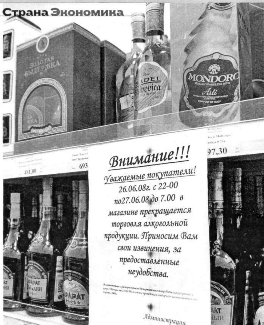
ЗАПРЕТ Если ночную торговлю алкоголем прекратят, застолья реже будут затягиваться до утра

и следующий шаг—новый способ сбора акциза на спирт. Сейчас меньшую часть акциза берут на спиртовом заводе, а большую—там, где делают готовый продукт: водку, коньяк, ликеры и настойки. Получается, что дешевый спирт уходит на ликеро-водочный завод и по пути исчезает из поля зрения налоговых чиновников. Он и идет на изготовление левой водки. Поэтому и происходят статистические чудеса: в один год производство спирта и производство водки могут вырасти или упасть совсем по-разному. Если весь акциз брать в начале пути, то спирт станет дороже и делать из него дешевую водку будет сложнее. Заодно придется контролировать передвижение каждой цистерны—для перевозок спирта нужно будет получать специальную лицензию. Росалкоголь предлагает ввести новый порядок уже с 2010 года, Минфин указывает на 2011 год—бюджет уже принят, а акцизы распределены между регионами, снова делить их поздно.